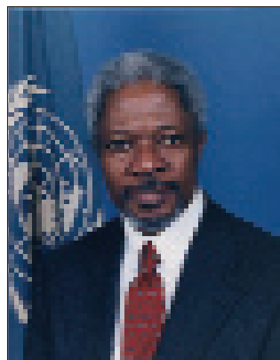
Kofi Annan Secretario General de las Naciones Unidas

KOFI ANNAN SECRETARIO GENERAL DE LAS NACIONES UNIDAS