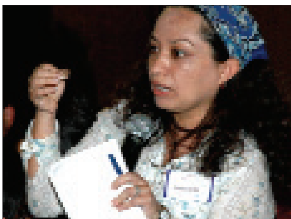
Una joven hace escuchar su voz en una reunión juvenil inter- religiosa.